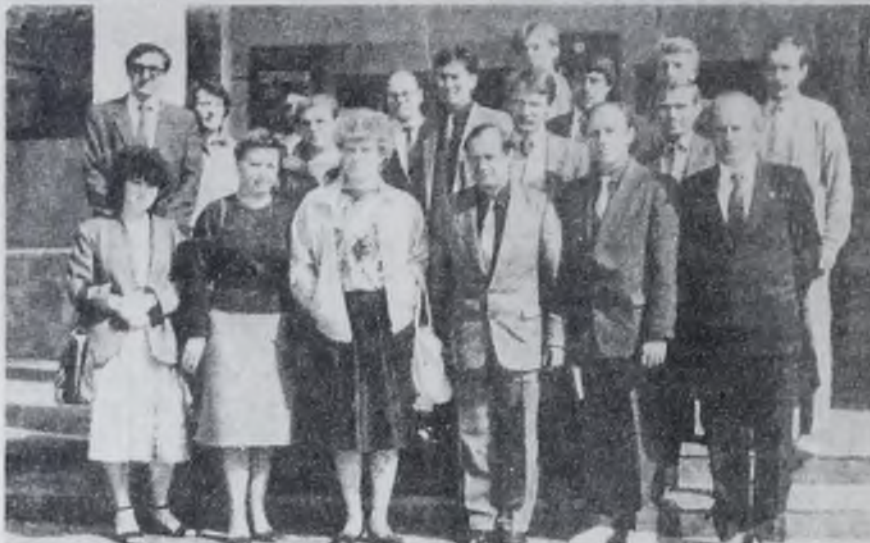
Снимок на память.