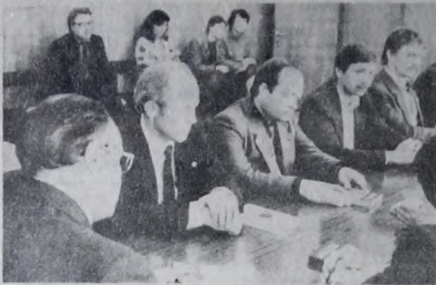
На встрече в парткоме выпускники УМЛа.

Выпускникам были вручены книги, сделана памятная фотография.