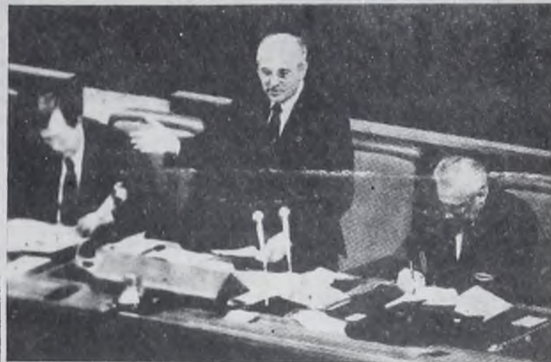
Москва. Кремлевский Дворец съездов. Съезд народных депутатов СССР.

На бюро рассмотрена записка парткома АУС «О результатах организаторской и политической работы партийных, общественных организаций Ангарского управления строительства по обеспечению подготовки и проведению выборов народных депутатов СССР».