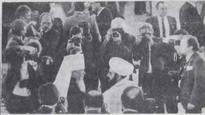
Народные депутаты СССР представители духовенства в перерыве между заседаниями встретились с журналистами.