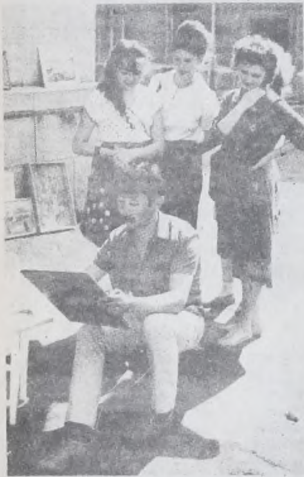
Интересно и необычно.

День был необычайно солнечный. Так и поднимались вверх фонтанчики лучей. За последние годы такая щедрость и изобилие тепла в мае не наблюдались. Сама природа подарила нашему городу в день его рождения именно такой день. Несмотря на то, что соблазнов много, — и приусадебные участки, и берег реки Китой, отдых в прохладной лесной зелени — праздновать день рождения своего города вышли на улицы тысячи и тысячи ангарчан.