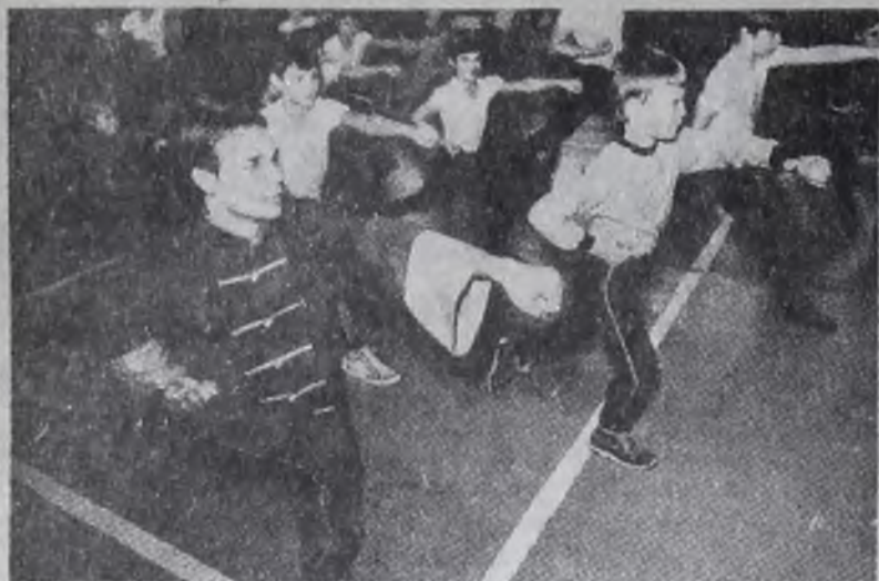
Москва. В конце ноября 1988 года на базе центрального научно-исследовательского института медико-биологических проблем спорта Госкомспорта СССР открылся научно-

практический центр нетрадиционных методов оздоровления.