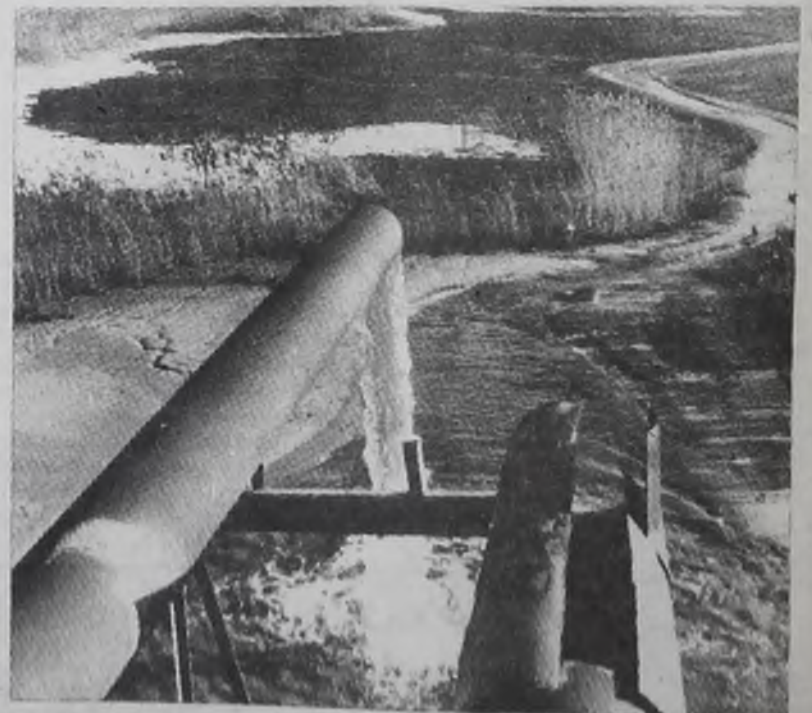
шую территорию рядом с Волгой. Специалисты подсчитали, что ежемесячно на город Калинин выпадает около 44

НА СНИМКЕ: жидкие отходы Калининского объединения «Химволокно» затопили боль-