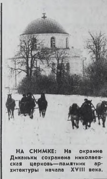
НА СНИМКЕ: На окраине Диканьки сохранилась николаевская церковь—памятник архитектуры начала XVIII века.

Наш почтовый адрес: 665842, Ангарск, управление строймеханизации. Провед трассы №№ 1, 4, 7 до остановки «Энергосбыт» (по требованию). Справки по телефону: 9-67-34.