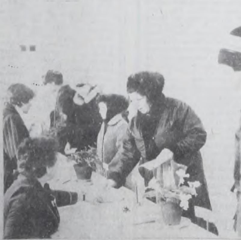
На избирательном участке.