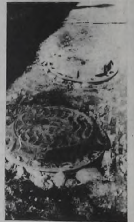
Разрыв в асфальте из-за неготовности колодца по вине СМУ-1 [дтсад 13 в 17 микрорайоне].

Из-за неуплотнения грунта в обратных засыпках подземных сетей в местах проездов ОИМик и ОКК систематически закрывали выдачу асфальта и бетона, и только по согласованию с руководством АУС производилась их поставка. До последнего дня идет установ-