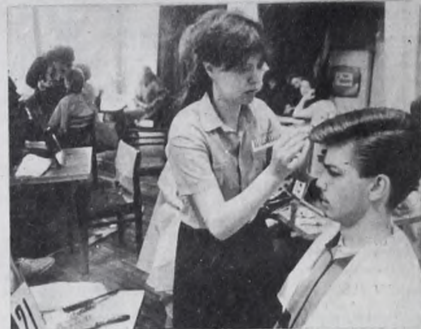
Этот традиционный весенний городской конкурс парикмахеров и косметологов, проходящий в ДК «Строитель» в ми-

— Самый распространенный метод, направление — это общезвестный «Сессун», — го-