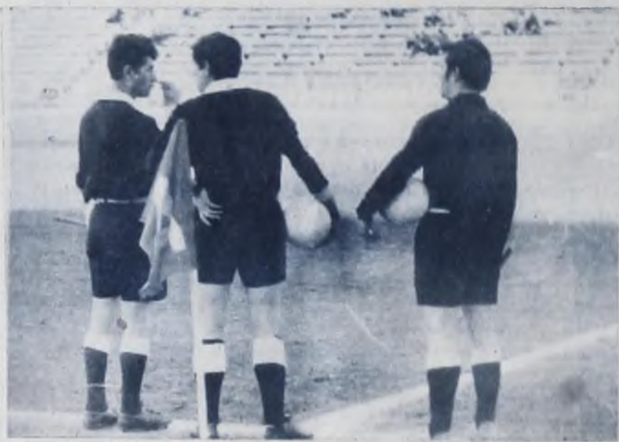
А судьи кто!