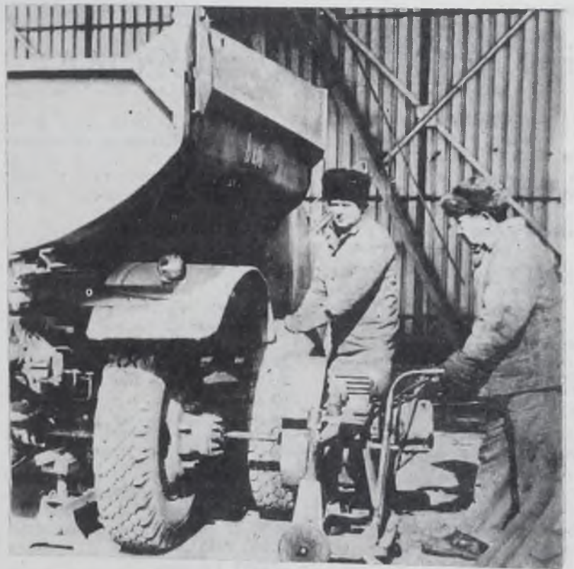
♦ Приспособление для снятия колес.

В коллективе сегодня решена проблема устройства детей дошкольного возраста, то есть все нуждающиеся обеспечиваются детскими садами и яслями. Во всем, что делается в автобазе, чувствуется та общая атмосфера заботы и вни-