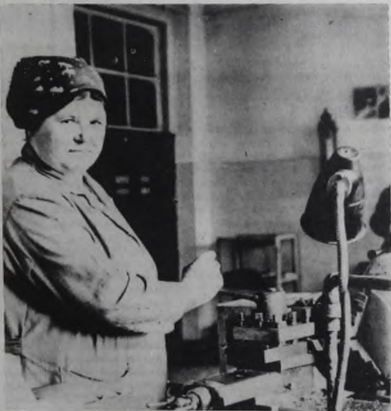
♦ Рабочее место.

ТО и ТР оснащены электро-телеферами, кран-балками, многопостовыми солидолонгнетателями. С целью облегчения труда при ремонте автомобилей в автобазе применяются приспособления для снятия колес, коробок передач, редукторов задних мостов, шкворней, также применяются пневматические гайковерты.