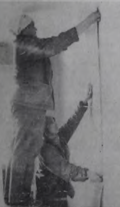
Последние метры обоев наклеивают в жилых комнатах общежития.