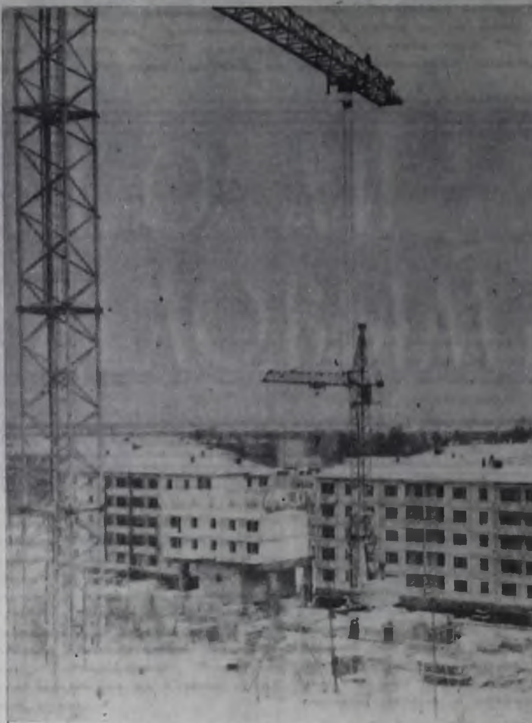
Новостройки ба микрорайона.

На заводе железобетонных изделий № 5 около 400 человек приняли участие в субботнике, средства от которого будут перечислены в Фонд мира. В этот день было изготовлено промышленной продукции — 6 тыс. куб. метров, в том числе железобетона — 100 куб. метров, бетона — 101 куб. метр.