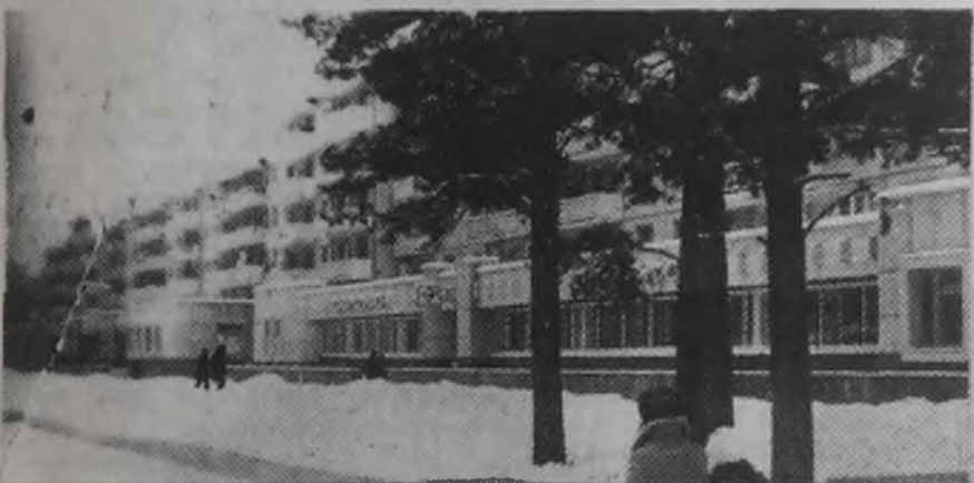
Этот живописный уголок 206 квартала выстроен коллективом участка № 2.