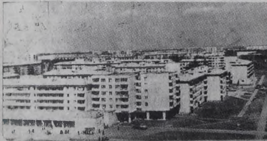
22 микрорайон города Ангарска.