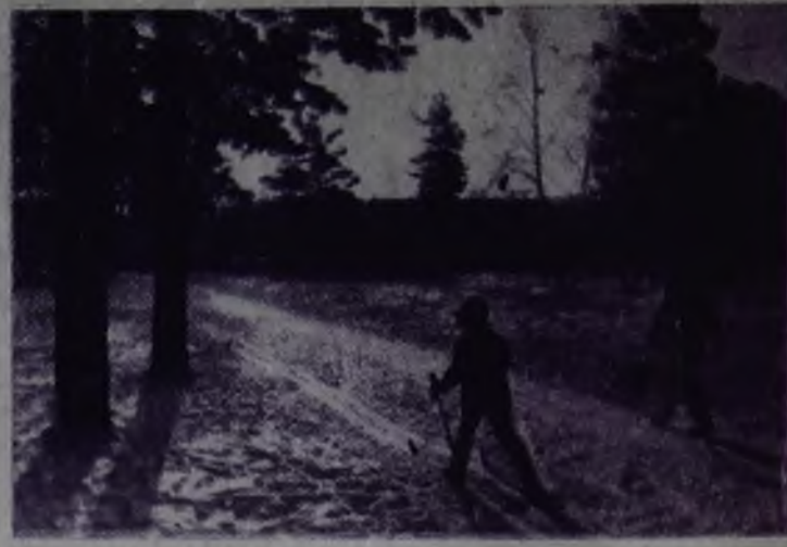
Солнце, воздух и вода — наши лучшие друзья.