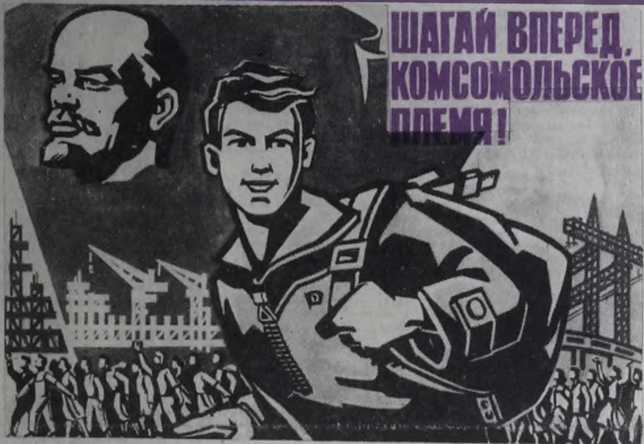
Плакат художника Ю. Кершина.