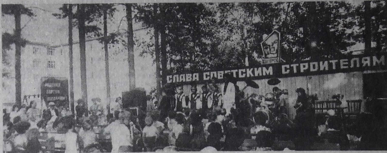
На агитплощадке 7 микрорайона.

А праздновалась в 7 микрорайоне вот какая дата — 18-летие со времени заселения первых домов, «совершеннолетие» микрорайона. Вечером 11 августа звуки духового оркестра звали жителей на праздник. Недалеке от агитплощадки расположились лотки и прилавки с фруктами, напитками, кондитерскими и кулинарными изделиями.