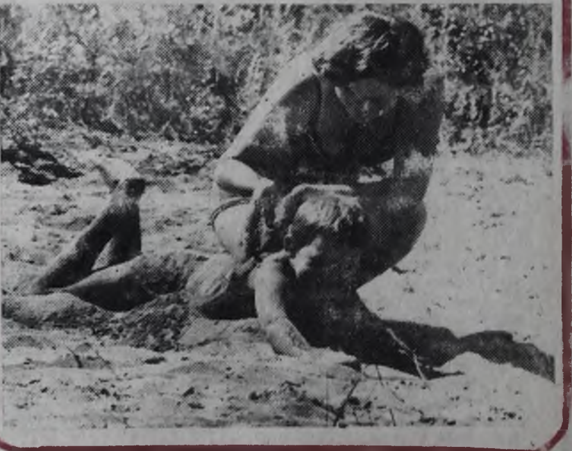
Саффи (мультфильм). 9-40, 13-30, 15. Бармен из «Золотого якоря». 11, 17 (удл.), 21.