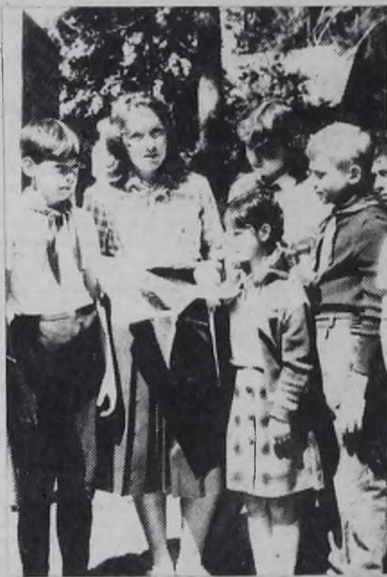
С вожатой.

— Трудянки Одинского совхоза — частые гости пионерского лагеря. Заработанные деньги на полях совхоза ежегодно перечисляются в Фонд мира, на строительство монумента Славы в Артеке, на счет 904. Трудовое объединение «Русь» добросовестно выполняет договор с подшефным совхозом на выполнение сельскохозяйственных работ. Надо сказать, что воспитание трудом — это тоже часть нашей педагогической работы.