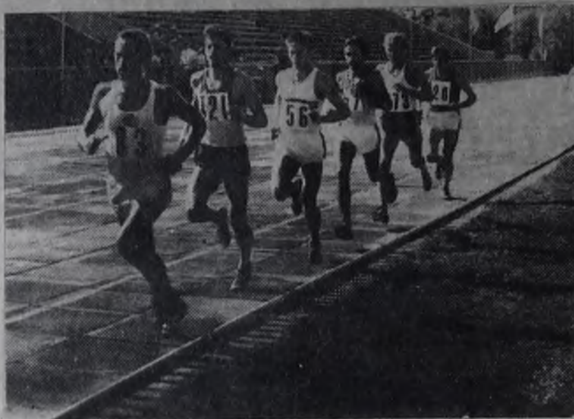
На снимке: летние старты.