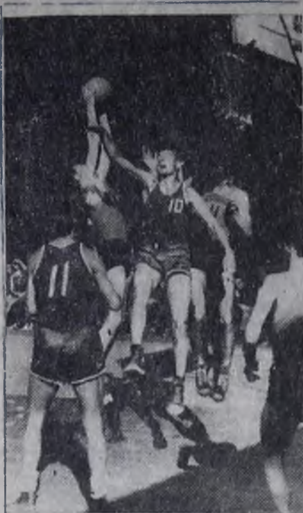
В подразделениях стройки полным ходом идет летняя спартакиада. Закончились теннисные турниры, проходят

встречи футбольных команд, почти все коллективы физкультурны участвуют в сдаче норм ГТО. Финальные соревнования по многоборью ГТО пройдут 11—13 августа.