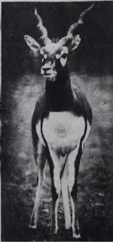
Наш аврнисаж.