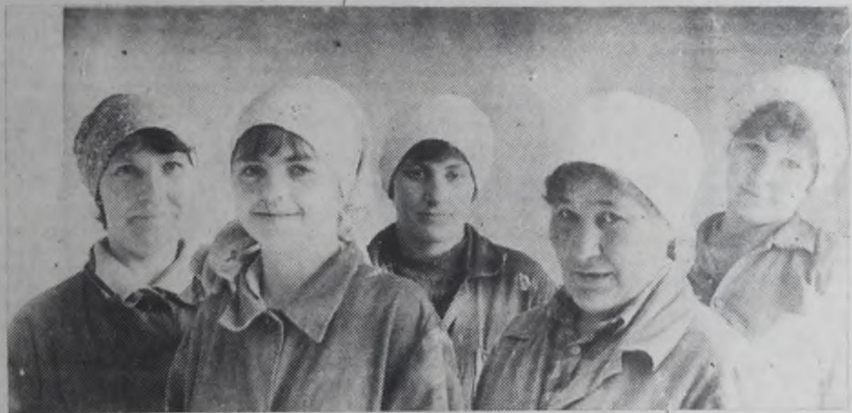
Одна из бригад, что работает на отделке наружных