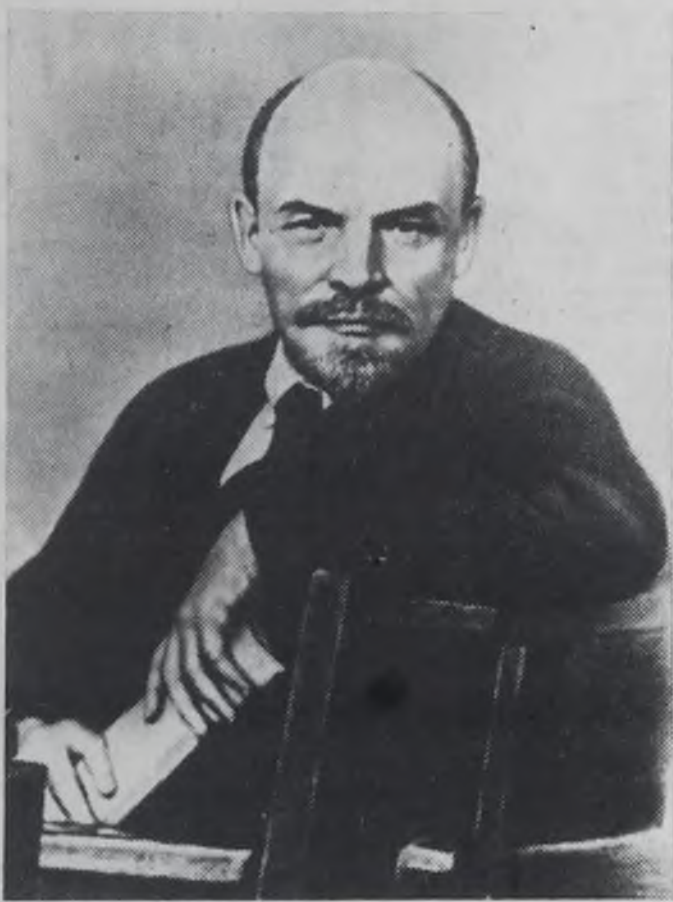
В. И. Ленин на X Всероссийской конференции РКП(б) в мае 1921 г. (Фрагмент фотографии: В. И. Ленин среди делегатов X Всероссийской конференции РКП(б).

Хорошо помогает сквозной догвор с бригадами-поставщиками, заключенный в начале