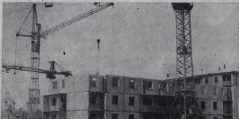
Строится жилой дом в 12а микрорайоне.