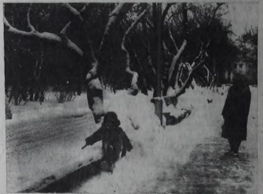
В февральском наряде.

Эта синяя беда — после дождичка вода, заливается в ботинки, размывает все картинки. Я, разбрызгивая воду, босиком по ней бегу, потому что я ботинки нынче к школе берегу.