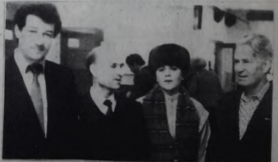
Делегаты от СМУ-1.

В 1986 году на выполнение номенклатурных мероприятий