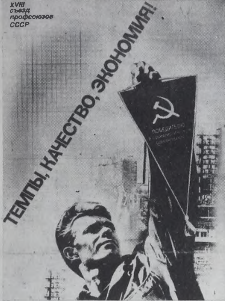
Плакат художника М. Урасовой. Издательство «Плакат».