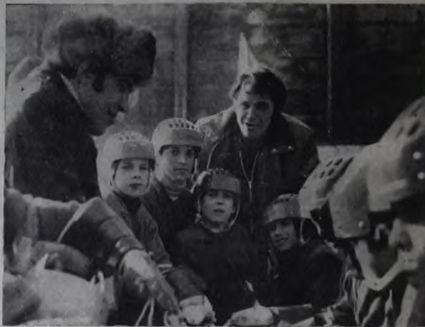
Анатолий Фирсов и ангарские мальчишки.

Руководством ДЮСШ ежегодно проводятся родительские собрания в начале учебного года и перед выездом в спортивный лагерь. На этих собраниях рассматриваются вопросы о нормах и правилах поведения советского спортсмена на тренировках, на соревнованиях, в быту, школе, на улице, о соблюдении режима, о проблемах воспитания подростка в настоящее время. В школе создан родительский комитет, но практическую работу он осуществляет не на должном уровне. Недостаточен контакт тренеров с учителями школ, родителями. Родительские собрания не во всех отделениях проводятся