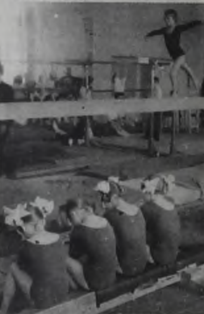
И радости побед, и слезы поражения.

Воспитание подрастающего поколения была и есть проблема № 1. Антон Семенович Макаренко говорил, что воспитательный процесс совершается не только в классе, а буквально на каждом квад-