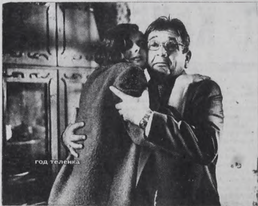
его предыдущая работа «Груз без маркировки» была высоко оценена зрителями.