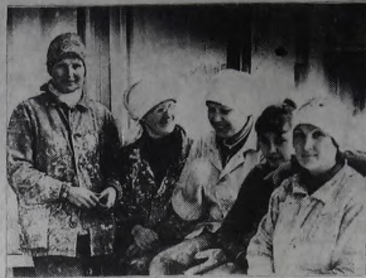
Отделочные работы на магазине «Универсам» в 18 микрорайоне, что называется, вступили в завершающую стадию. В будущих торговых залах уже выложена плитка, окрашены панели, переплеты окон, ведется обделка деревом радиаторов отопления. В этом месяце строители должны сдать этот объект социального назначения.