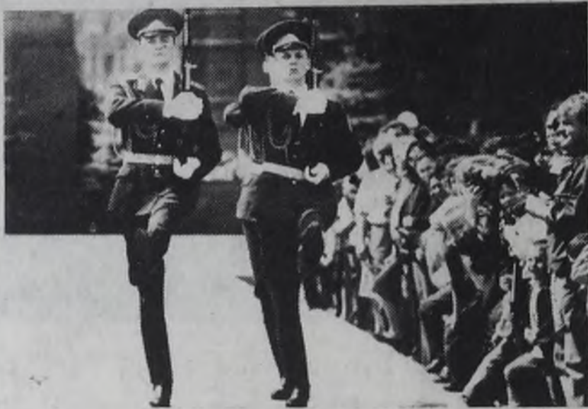
На пост номер один...