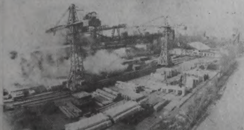
на заводском полигоне.