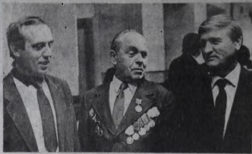
И вновь на свой профессиональный праздник в ДК «Строитель» в минувшую пятницу собрались автомобилисты стройки. Трудовыми подарками отметили они этот день.

План девяти месяцев выполнен на 111,9 процента. Перевезено дополнительно 1 млн. 88 тысяч тонн народнохозяйственных грузов.