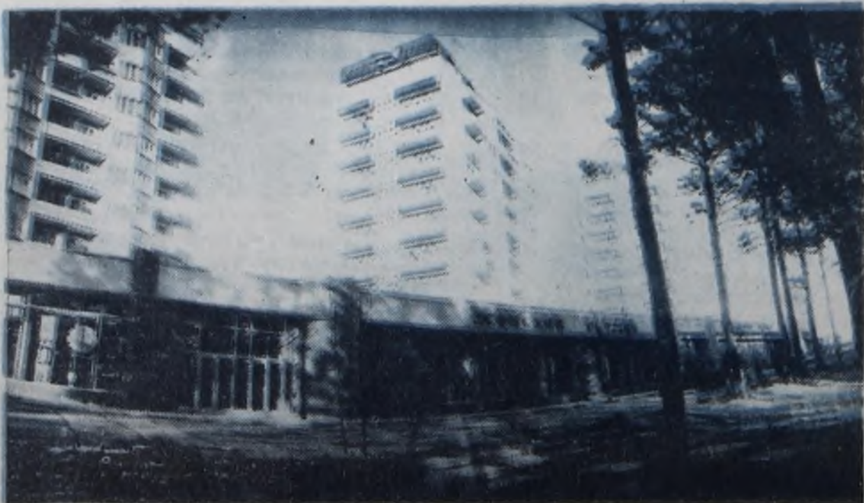
Из серии «Архитектура Ангарска».