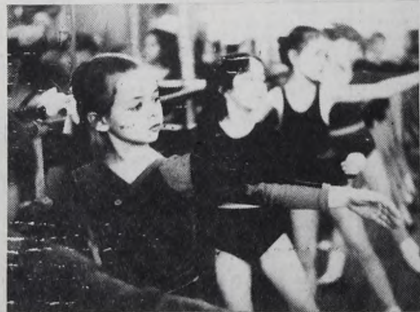
В хореографическом классе.