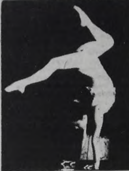
Закончится представление, скоро уедет передвижной цирк, но его огни помнишь долго, они незабываемы, потому что любимы.