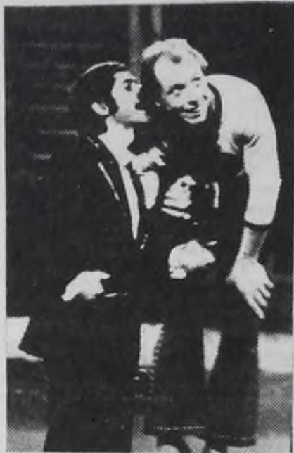
На гастролях в Ангарске Московский государственный

передвижной цирк. Помните, у Сергея Михалкова: