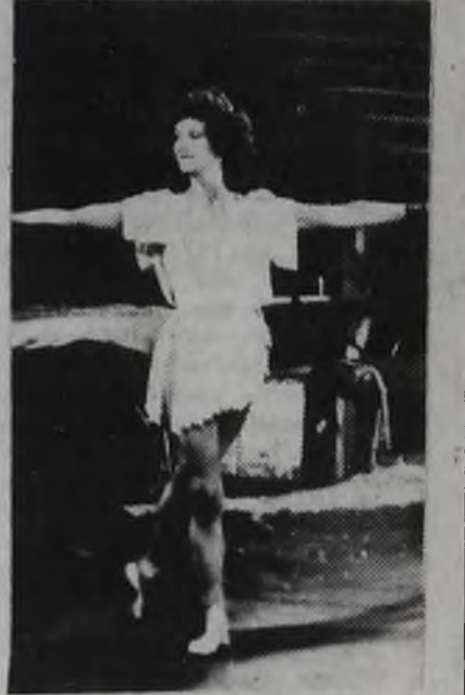
Фото и текст А. КОКОУРОВА.