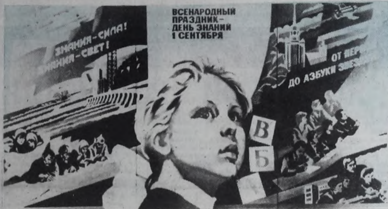
Плакат художника Н. Байракова.