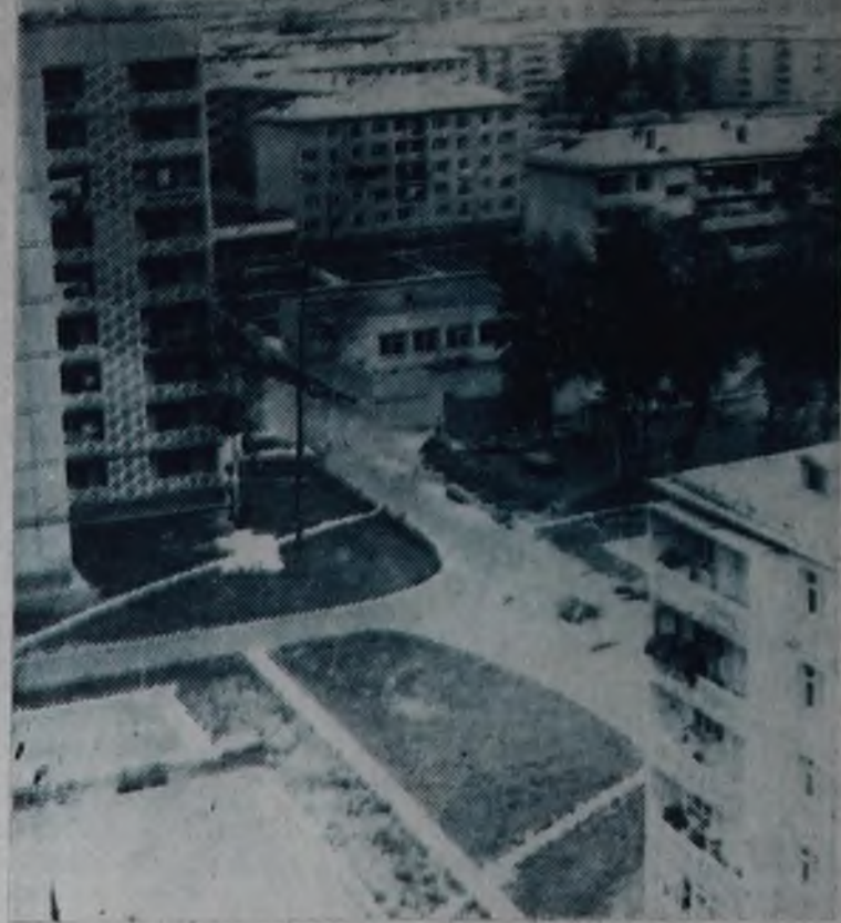
Ангарск, 18-й микрорайон.