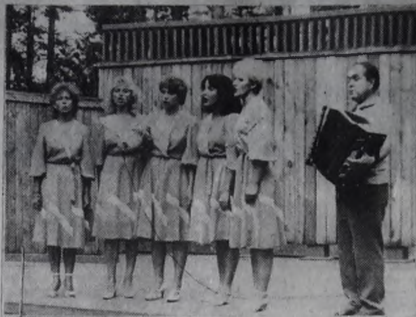
Ансамбль «Радуга» из ДК «Зодчий».