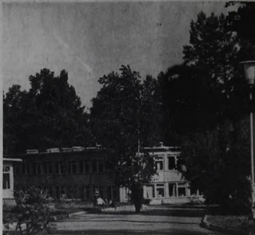
Светлые, уютные корпуса в «Космосе».

У нас много различных кружков: мастерская добрых дел, выжигания, макраме, мягкой игрушки, авиамодельный, танцевальный и другие. В читальном зале библиотеки можно почитать интересную