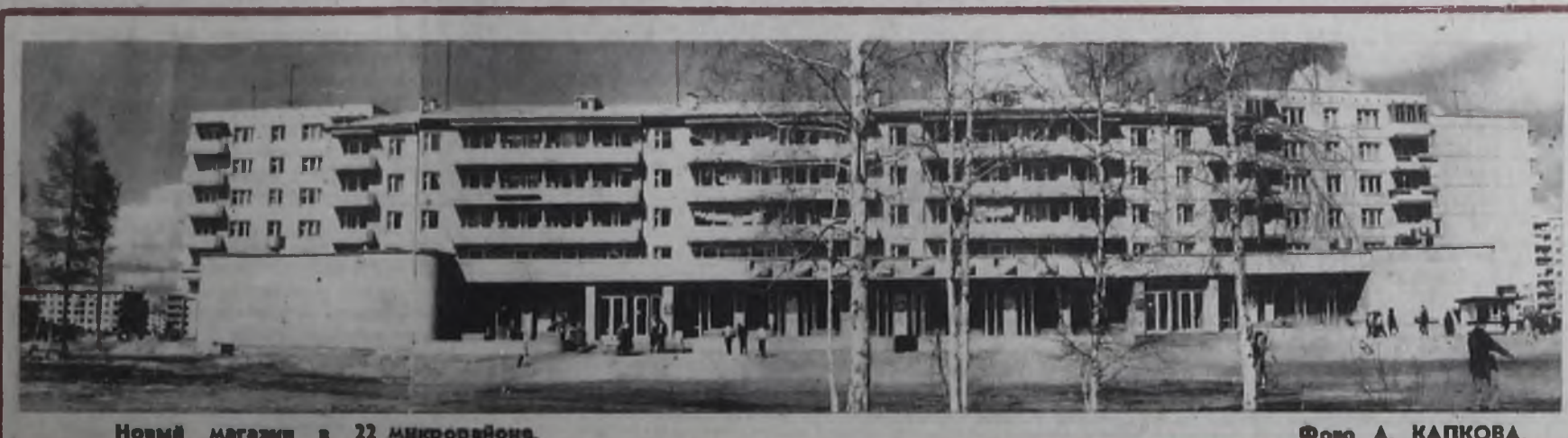
Новый магазин в 22 микрорайоне.

Более подробную информацию и техническую документацию можно получить в ЦНТИ по адресу: 664047, г. Иркутск, ул. Коммунаров, 10. Тел. 27-34-91.