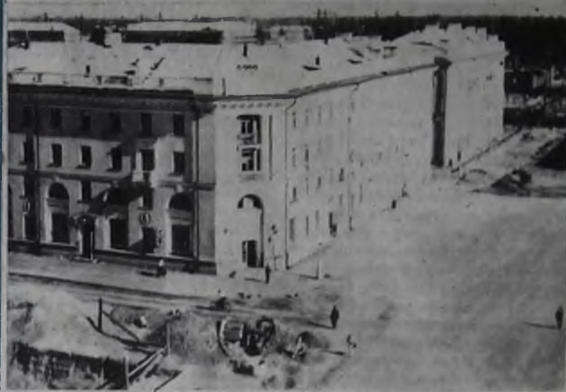
Центральные магистрали города — улица Ленина и проспект Карла Маркса — пересекаются на главной площади носящей имя Владимира Ильича Ленина. На верхнем снимке вы видите парашютиста, вооруженного на площади, нижнем — таков окончательный ансамбль площади в 50-х годах.