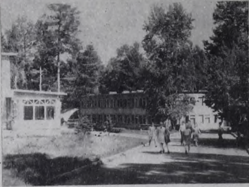
Корпуса пионерского лагеря «Космос».