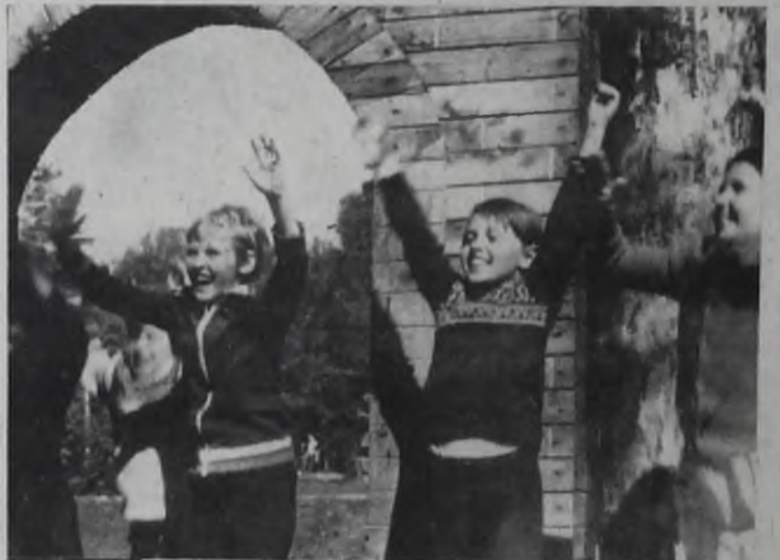
Игры, аттракционы ждут ребят в сказочном городке.