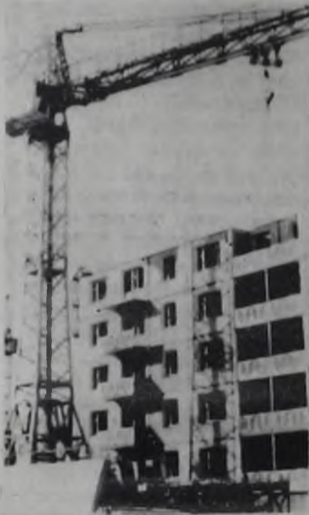
Из серии «Ангарск строится». Строительство жилья в 17 микрорайоне.