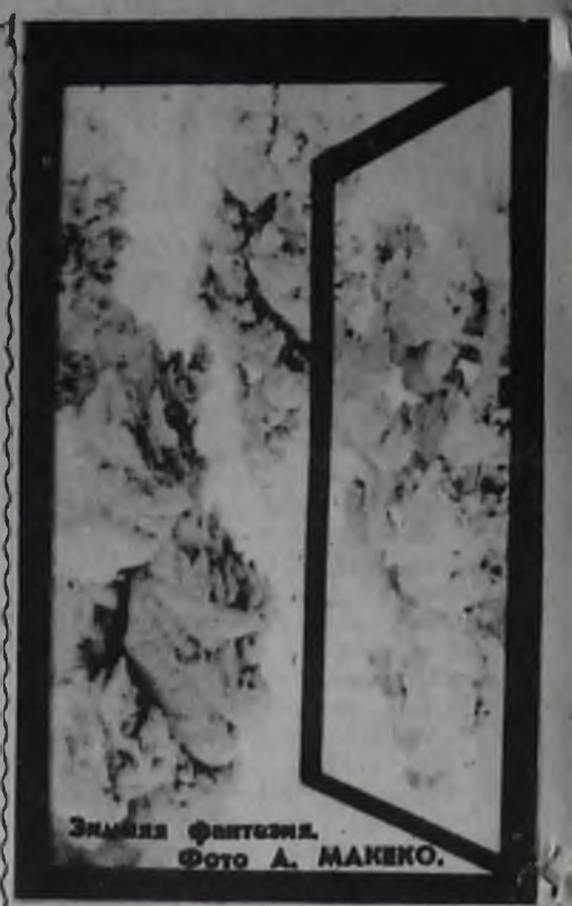
Экспозиция фотозала.

Адрес: г. Ангарск, ул. Октябрьская, 54а.