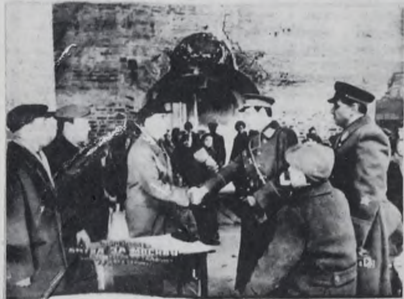
Войска в боях за Москву