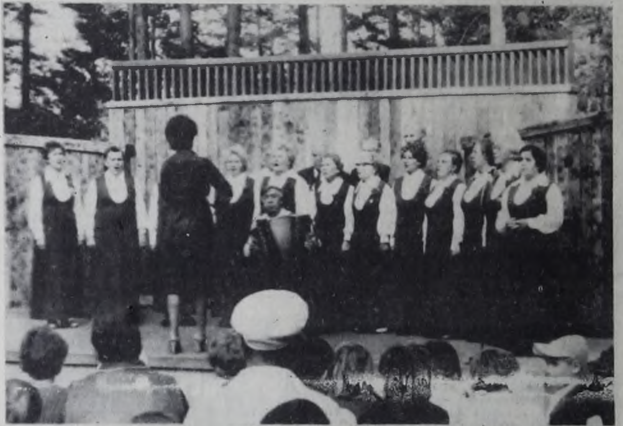
Хор ветеранов «Красная гвоздика».