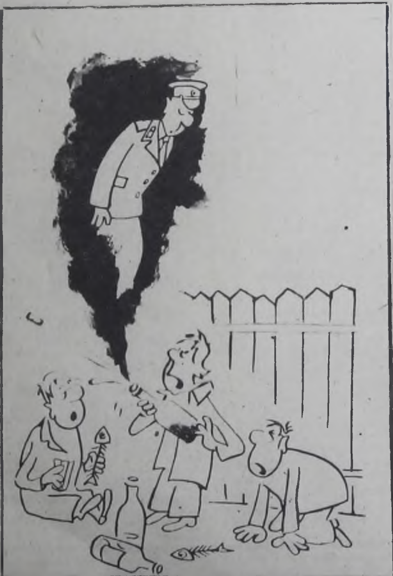
Без слов. Художник М. Салин (Из сборника «Мастера советской карикатуры». Выпуск V).