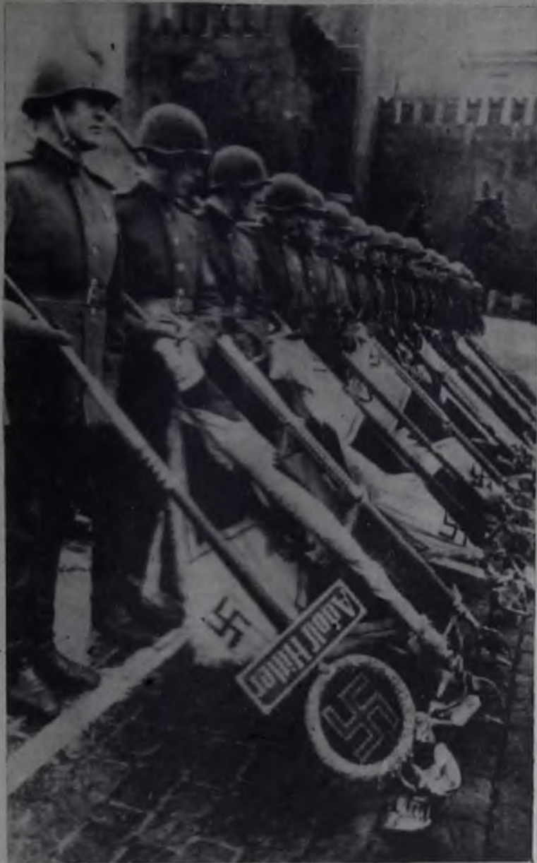
Москва. Парад Победы 24 июня 1945 года.