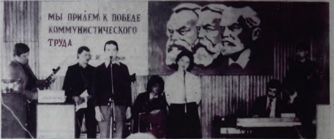
Большой популярностью среди работников строительного управления № 7 пользуется молодежный вокально-инструментальный ансамбль, созданный по инициативе комсомольцев СМУ. На одном из праздничных вечеров ансамбль выступил в красном уголке управления.