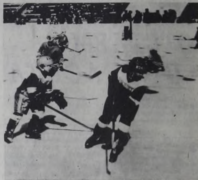
В атаку идут призеры соревнований — хоккеисты ивановского «Сокола».