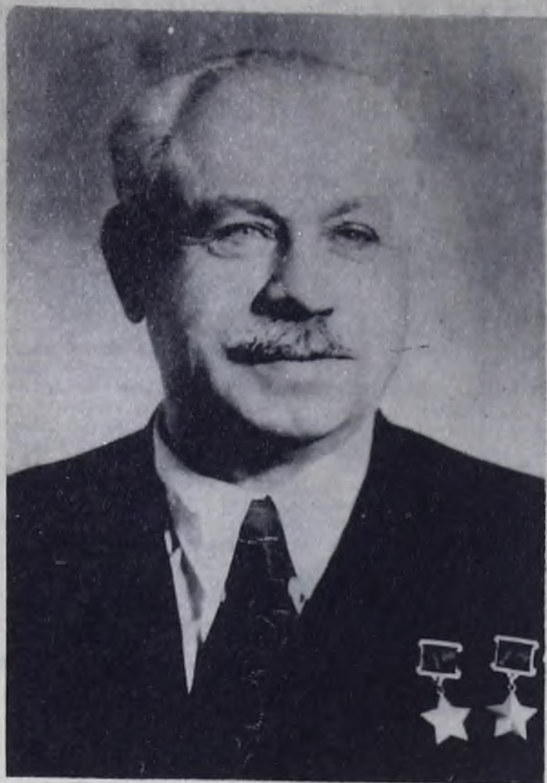
26 НОЯБРЯ ИСПОЛНИЛОСЬ 90 ЛЕТ СО ДНЯ РОЖДЕНИЯ (1894) И. Д. ПАПАНИНА, СОВЕТСКОГО ПОЛЯРНИКА, ДВАЖДЫ ГЕРОЯ СОВЕТСКОГО СОЮЗА На снимке: Иван Дмитриевич Паланин.