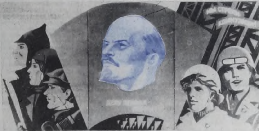
ДА ЗДРАВСТВУЕТ ЛЕНИНСКИЙ КОМСОМОЛ — НАДЕЖНЫЙ ПОМОЩНИК И БОЕВОЙ РЕЗЕРВ КОМУНИСТИЧЕСКОЙ ПАРТИИ!

Антивоенный митинг закончился. Но как только начали густеть сумерки, сотни пар-