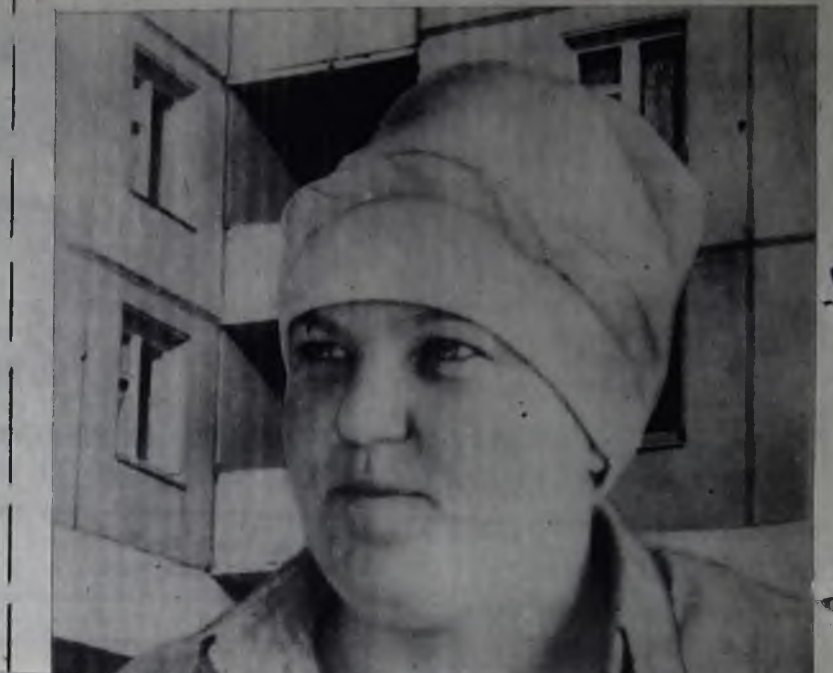
Из серии «Архитектура Ангарская». Магазины «Олимпиада».