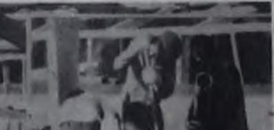
бумажной ханью по руб. 20

Ателье «Белка» предлагает услуги по пошиву, ремонту и обновлению различных головных уборов. В настоящее время ателье не перегружено работой и может обслужить вас в короткий срок.