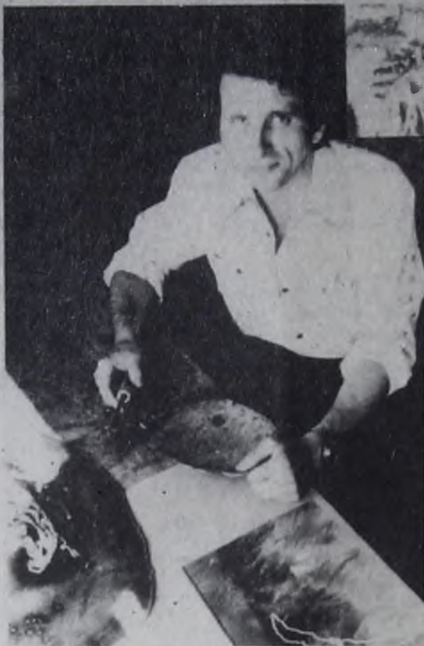
дал трещины, в затем последнее — увидеть, проявить его естественный рисунок.

Книги «Вокруг Байкала», «Сибирь. Откуда она и куда идет?», «Сибирь, Сибирь», «Иркутский меридиан» отделаны корой сосны. Это и золотистые чешуйки верхней части сосны, и могучая, темная, с красновато-вишневыми оттенками кора основания. Мастер использует многие материалы. Например, нарост деревьев — кап. Но чтобы отобрать, необходимо просмотреть сотни деревьев, пока не найдешь нужное, затем надо срезать, высушить в течение нескольких лет, чтобы он не