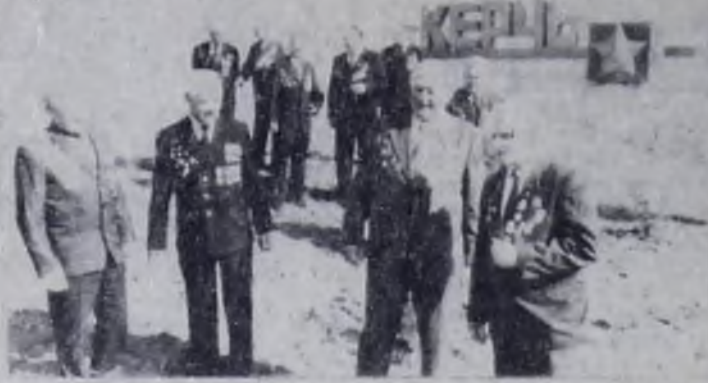
К 40-ЛЕТИЮ ОСВОБОЖДЕНИЯ КЕРЧИ ОТ НЕМЕЦКО-ФАШИСТСКИХ ЗАХВАТЧИКОВ (11 АПРЕЛЯ)

КРЫМСКАЯ ОБЛАСТЬ. Двадцатью артиллерийскими залпами салютовала 11 апреля 1944 года столица нашей Родины—Москва—воинам отдельной Приморской армии, Черноморского флота и Азовской Военной флотилии, освободившим Керчь.