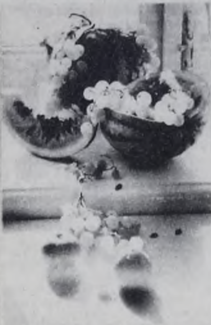
Дары осени.