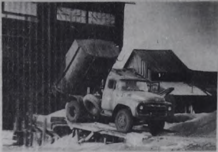
Окончание. Начало на 1 стр.