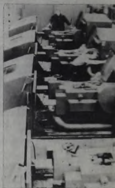
На снимке: на участке новых станков-автоматов.

В цехах и на участках предприятия установлены высокопроизводительные агрегаты и станки, которые уже выдали первую продукцию. При этом значительно выросла производительность труда, увеличилось количество и улучшилось качество выпускаемой продукции. Возросла культура производства.