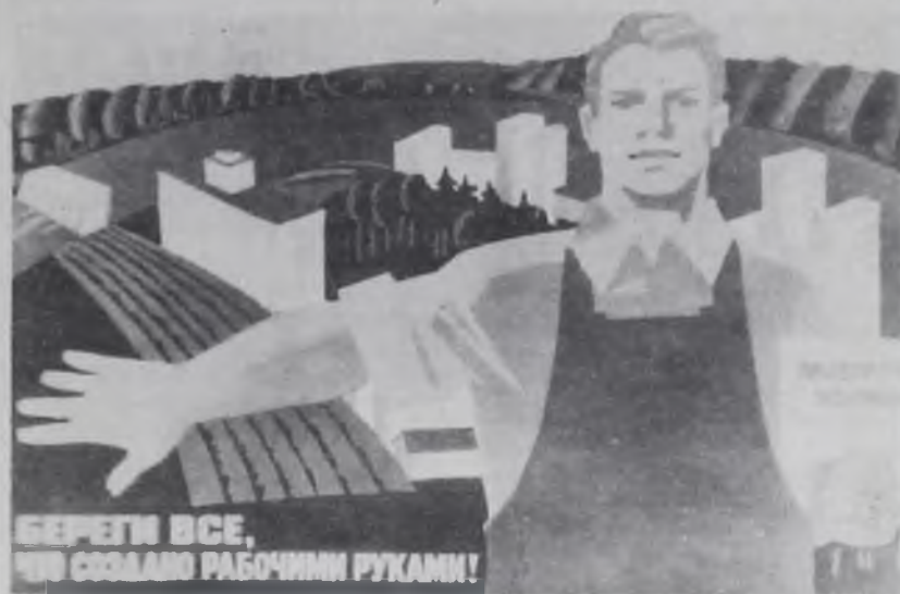
В ОБЪЕДИНЕННОМ ПОСТРОЙКОВЕ